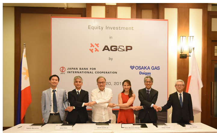
株主間契約、協業契約 調印式の様子

Daigasグループは、長期経営ビジョン・中期経営計画「Going Forward Beyond Borders 2030」において、海外エネルギー事業の展開を加速していくことを目指しています。今後も天然ガス需要の伸びが期待される東南アジアを重点活動地域と位置付け、同地域を含めた海外エネルギー事業を拡大してまいります。