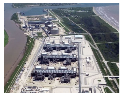
フリーポート LNG プロジェクト液化設備の外観、 (FLNG Development 社 提供)