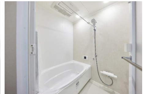
⑥ 省エネ機器 (節水型の浴槽・シャワー・水栓)