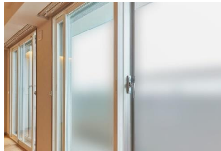
⑤ 内窓 (Low-E 複層ガラス)