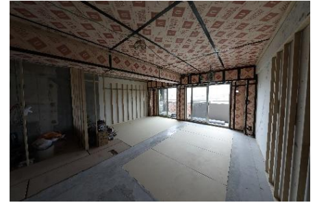
③ 断熱処理後 (熱抵抗が大きい断熱材)