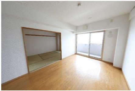
① リノベーション前