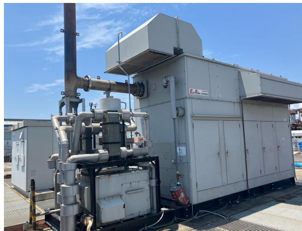
<400kW ガスエンジンコージェネレーションシステム「EP400G」>

大阪ガス株式会社(社長:藤原正隆、本社:大阪市中心区、以下「大阪ガス」)、大阪ガスの 100%子会社の Daigas エナジー株式会社(社長:福谷博善、本社:大阪市中心区、以下「Daigas エナジー」)は、ヤンマーエネルギーシステム株式会社(社長:山下宏治、本社:兵庫県尼崎市、以下「ヤンマーES」)と共同で、ヤンマーES製の都市ガス仕様コージェネレーションシステム「EP400G」において、都市ガスに水素燃料を 30%混焼する実証運転試験に成功しました。