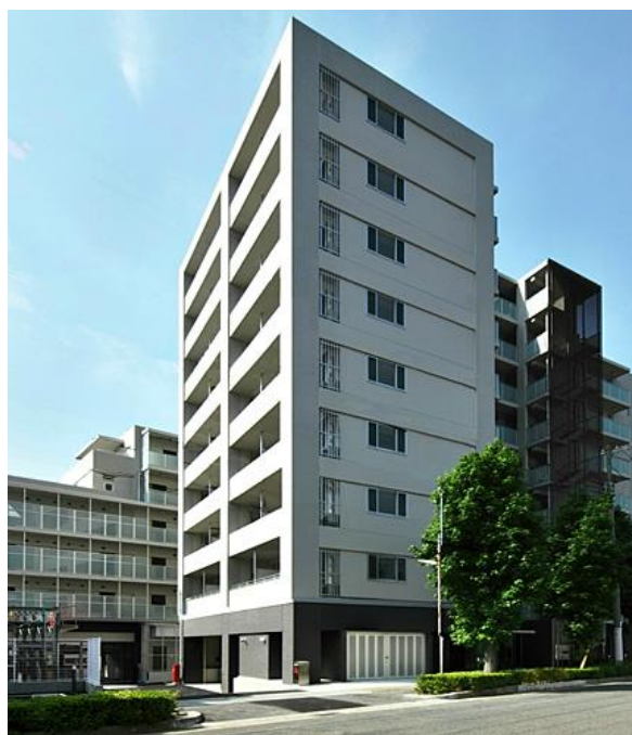
アーバネックス神戸六甲（神戸市灘区）