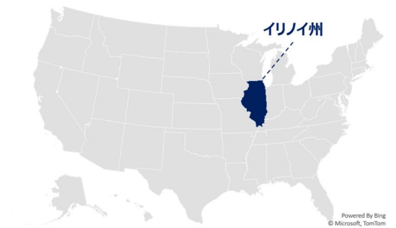
図2 イリノイ州の位置