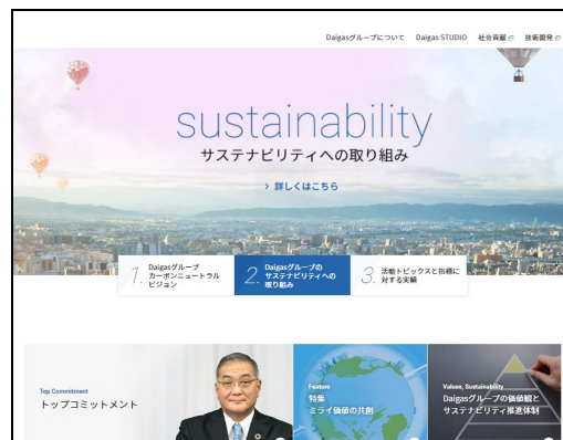
「Daigas グループ サステナビリティサイト」