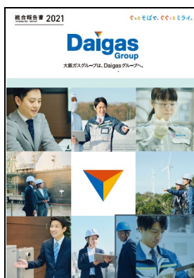
「Daigas グループ 統合報告書 2021」

当社グループは今後も事業活動を通じて、お客さま、社会、株主さま、従業員とともに、持続可能な経済成長と社会的課題の解決を目指していきます。またこれらの取り組みは、各媒体の発行やコミュニケーションを通じて、ステークホルダーの皆さまへ報告していきます。