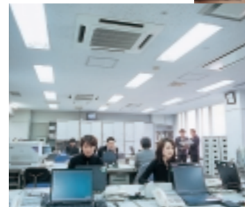
店舗やオフィスを快適に冷暖房するガス空調システム

ガスで冷暖房をするガス空調システムは、大型ビルや商業施設などに広く普及しています。ガスヒートポンプ式空調「ガスヒーポン」は、店舗や学校、オフィスビルなどを中心に近年ご採用が増えています。昨年4月には、発電機能を備えた新商品「ガスヒーポン ハイパワーマルチ」を発売し、ラインアップを充実させました。