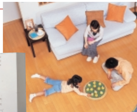
快適な暮らしを実現するエコウィル