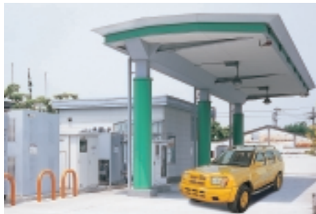
当社も参加する独立行政法人NEDO(新エネルギー・産業技術総合開発機構)のプロジェクトにより設置された水素ステーション

当社は、次世代のエネルギー源として注目されている水素を、天然ガスから製造する技術や装置の開発に取り組んでおり、装置のサイズ、販売価格ともに当社従来機の約2分の1となった「コンパクト水素製造装置 HYSERVE(ハイサーブ)」を、昨年4月から販売しています。今後、半導体分野などの水素を必要とする工業分野への販売を拡大するとともに、燃料電池自動車に水素を供給する水素ステーションでの活用を目指してさらに開発を進めていきます。