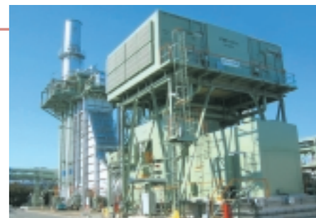
姫路製造所の発電設備

電力事業を展開するために姫路製造所内に建設していた5万kWの発電設備が、本年6月から運転を開始します。この発電設備は最新鋭のガスタービンを採用したコンバインドサイクル方式(ガスタービンと蒸気タービンを組み合わせた高効率発電システム)であり、同クラスの発電設備としては、世界最高レベルの高い発電効率を実現できます。また、窒素酸化物の排出を抑制する設備を採用し、環境にも配慮した発電設備となっています。