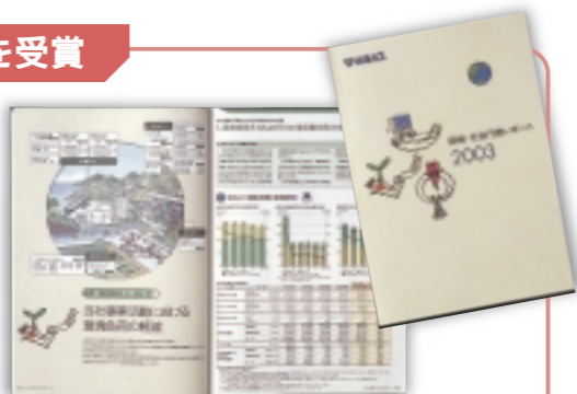
「環境・社会行動レポート2003」

当社は、環境負荷の軽減を金額で評価した環境経営指標を導入するなど、さまざまな環境行動に積極的に取り組んでいます。その成果をまとめた「環境・社会行動レポート2003」は、積極的な環境行動と情報の開示内容が高い評価を受け、本年1月、「第7回環境レポート大賞」において、最優秀賞である環境報告大賞(環境大臣賞)を受賞しました。今後もガス機器・システムの高効率化技術の開発やクリーンな天然ガスの普及を通じて、環境負荷の軽減に努めていきます。