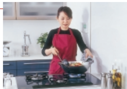
ご好評いただいているガラストップコンロ

ガラストップコンロは、美しい外観とお手入れのしやすさからご好評いただいています。平成15年度の販売実績も73,335台(前年比195%)と好調でした。特に、昨年10月に発売した「class S(クラスエス)」シリーズは、洗練されたデザインと各種の安全機能・便利機能を加えたシリーズとしてお客様の評価も高く、本年3月には新機種も発売し、バリエーションをさらに充実させました。