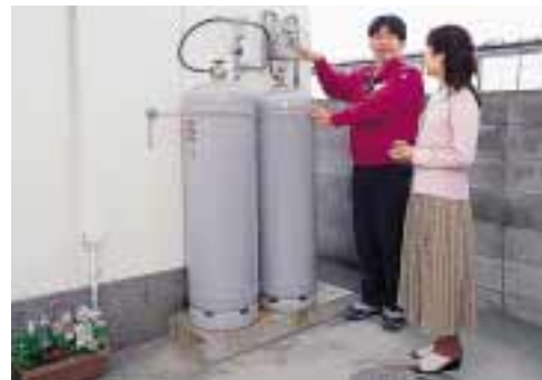
日本全国のお客さまにLPGをお届けしています

NIPG(日商岩井石油ガス(株))は、LPG(液化石油ガス)の輸入、販売を行う当社グループの中核会社です。NIPGグループ19社で全国のお客さまに営業を展開し、供給するLPGは、家庭用を始め、商業用、工業用など、多彩な用途に利用されています。