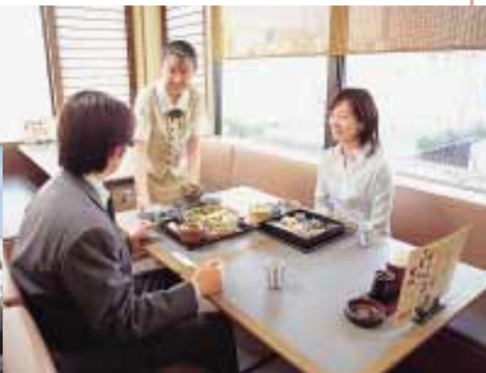
お客さまに「おいしさ」と「くつろぎ」を提供する「かごの屋」