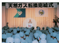
天然ガス転換完結式