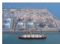
操業開始当時の姫路製造所 (兵庫県)