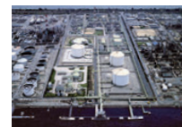
操業開始当時の泉北工場 (大阪府)