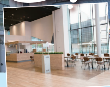
《2F ハグミュージアムカフェ》

コーヒー、ケーキ、日替りランチ等をご用意しております。 お気軽にお立ち寄りください。