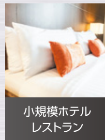
小規模ホテル レストラン