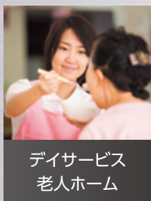
デイサービス 老人ホーム