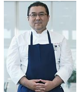
シンポジウム食の未来より